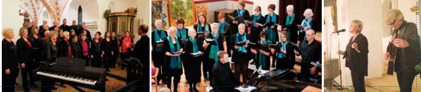
Midt Syd Kantori kommer til Mjolden.