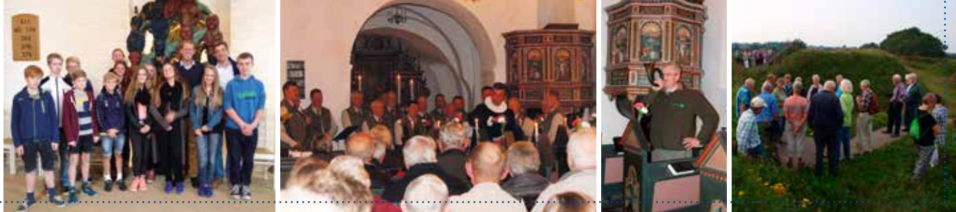
Konfirmanderne på tur til Flensborg.