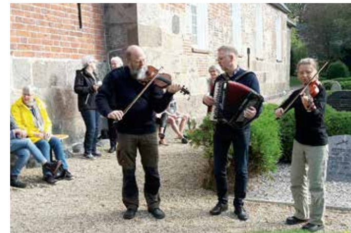
De gode spillefolk gav et ekstranummer efter høstgudstjenesten.

I begyndelsen af februar er det atter kyndelmisse, hvilket vil blive markeret i Døstrup Kirke søndag d. 2. februar kl. 17.30. Det bliver en lysgudstjeneste, hvor sognets konfirmander går med lys. I gudstjenesten vil der være mulighed for at tænde lys i kirkens lyskors og alle er velkomne til disse gudstjenester. Medbring gerne gamle lystumper, der gives videre til Kirkens Korshær.