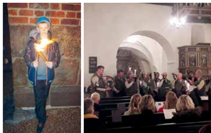
Der blev stået med fakler og blæst på jagthorn ved jagtgudstjenesten.

Som en naturlig del af at være kirke, samles der ind ved særlige lejligheder, når der er gudstjeneste. Således blev der i forbindelse med høstgudstjenesterne indsamlet kr. 1.186,00 i Døstrup Kirke til fordel for Kirkens Korshær og i Mjolden Kirke blev der indsamlet kr. 869,00 til fordel for Folkekirkens Nødhjælp. Tak for disse bidrag! Næste gang, der samles ind i kirkerne er ved gudstjenesterne juleaftens dag og juledag.