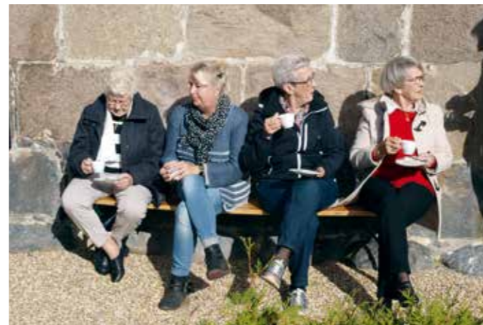
Kaffen nydes i oktobersolen ved høstgudstjenesten i Mjolden Kirke.