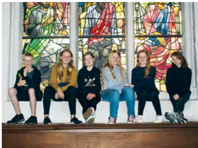
Konfirmanderne får sig et tiltrængt hvil i Marienkirche i Flensburg.